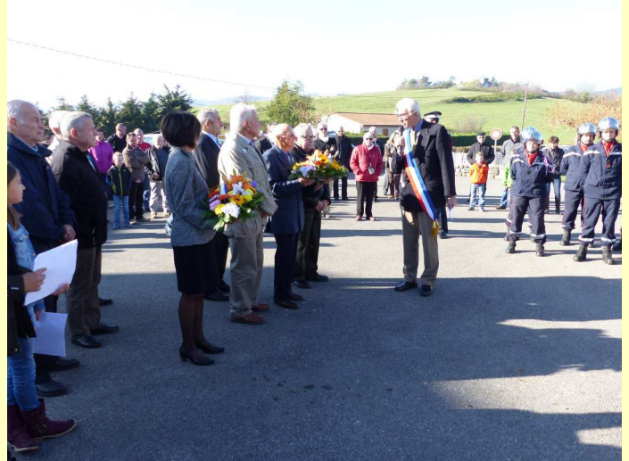
Une cérémonie empreinte de recueillement