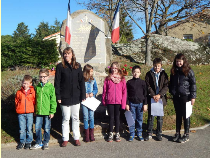
Les enfants de l'école d'Alboussière-Champis ont fait lecture d'un texte très émouvant.

Honorer la mémoire des victimes c'est permettre de revenir sur un fait historique et de le regarder à la lumière du présent. C'est le sens de la commémoration du 11 Novembre. Un grand merci à tous les participants.