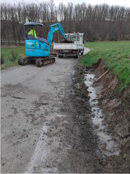
Fossés réalisés à Antoulin